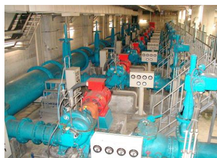
昭和浄水場 ポンプ室