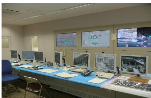
平瀬浄水場 操作室