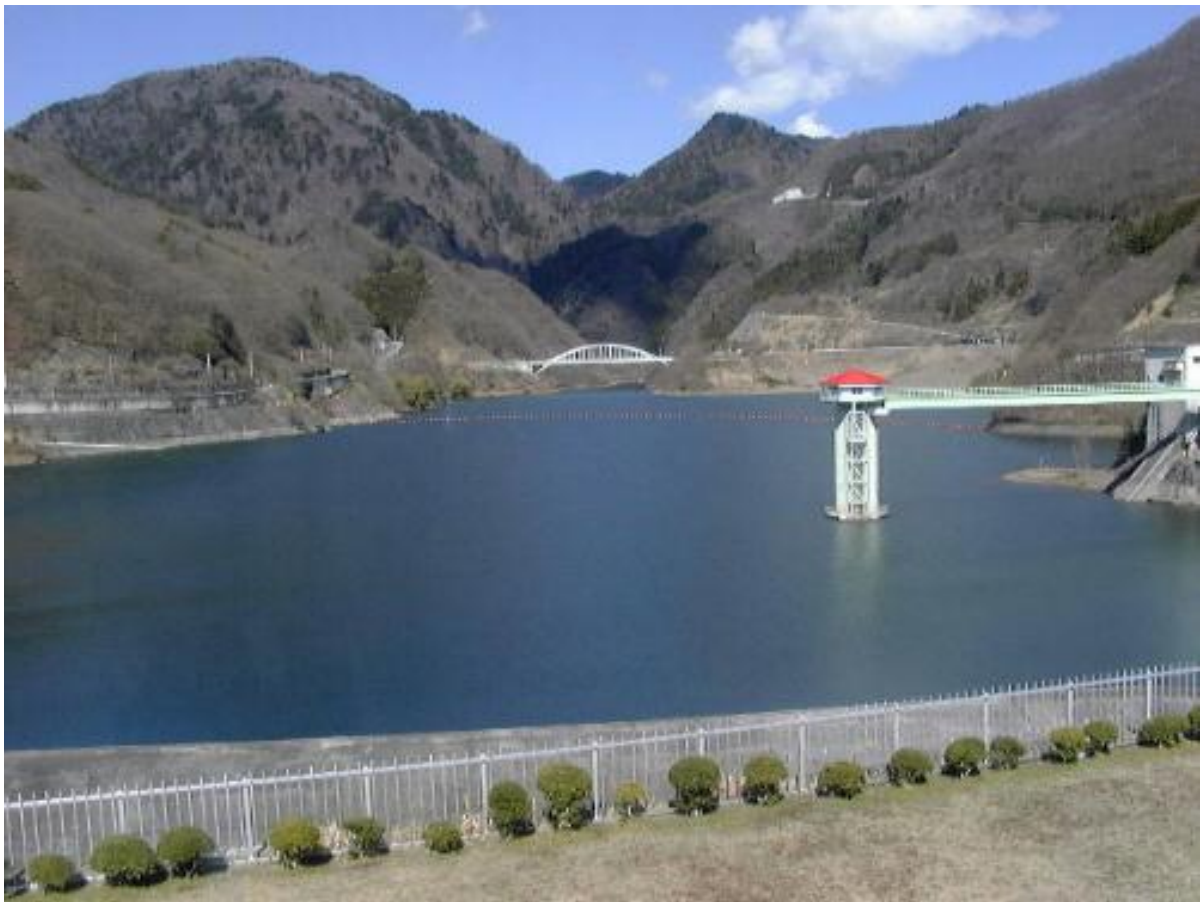
写真 荒川ダムと取水塔

水質管理の適正化を確保するために、採水地点、検査項目、検査頻度等を定め、その根拠も明記した「平成 27 年度水質検査計画」を策定いたしました。