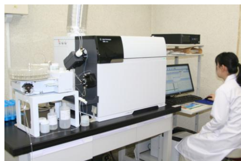
金属類項目の検査

水質管理上留意すべき項目とされ、将来にわたり水道水の安全性の確保等に万全を期する見地から、原水及び給水において年1回以上検査を行います。